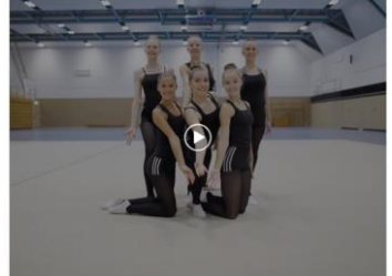
Die MTV Braunschweig ist einer von vielen Sportvereinen, die sich auf dem Marktplatz der Vereine präsentieren.

Präsentation der Braunschweiger Stadtmärkte am Sonntag, 26. September 2021