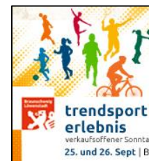
Banner 172 x 180 px