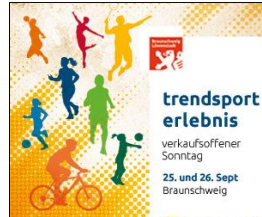
Banner 300 x 250 px