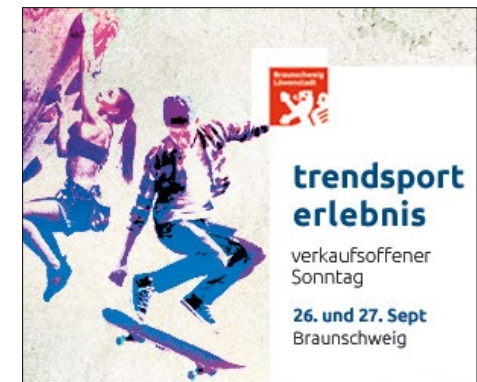
Banner 300 x 250 px