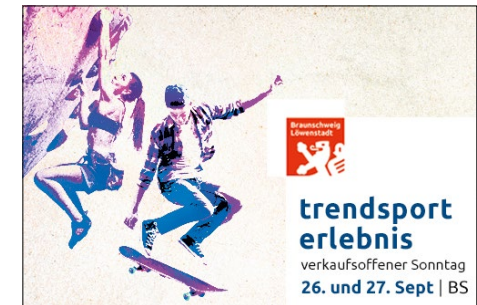
Banner 500 x 332 px