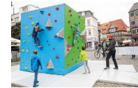
Auf dem Kohlmarkt übten Anfängerinnen und Anfänger des Klettersports ihre ersten Griffe am Boulderwürfel.

Auf den Slacklines von Volkswagen Financial Services auf dem Kohlmarkt bewiesen vor allem die jüngeren Besucherinnen und Besucher ihren Gleichgewichtssinn. Kreuz und quer ging es am Boulderwürfel, der besonders bei Anfängerinnen und Anfängern des Klettersports beliebt war. Auf dem Schlossplatz schafften etliche Mutige vor zahlreichen Zuschauerinnen und Zuschauern den Überschlag beim Looping Bike der Öffentlichen Versicherung Braunschweig. Angehende Skaterinnen und Skater luden bei der Skateacademy38 ihre ersten Meter auf vier Rollen zurück. Wer sich an diesem sportlichen Wochenende entspannen wollte, ruhte sich in einem der Mobilen Grünen Zimmert aus oder besuchte am Sonntag die Yogastunde von Yoga Ambiente, die kurzfristig in die St.-Magni-Kirche verlegt worden war.