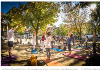
Auf dem Magnikirchplatz lädt Yoga Ambiente am Sonntag zu einer kostenlosen Yoga-Stunde ein.

Yoga Ambiente bietet eine kostenlose Yoga-Stunde unter freiem Himmel an. Besucherinnen und Besucher sind eingeladen, mit angelegten Sonnenrücken die sonnige Yoga-Outdoorsession 2020 zu beenden.