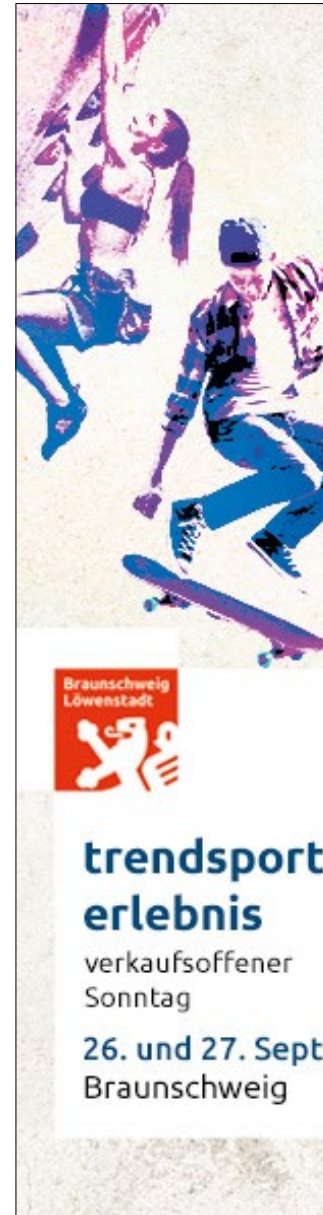
Banner 160 x 600 px