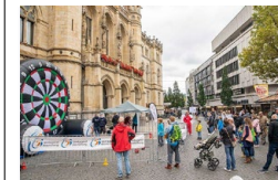
Treffsicherheit bewiesen Teilnehmerinnen und Teilnehmer am Sonntag beim Fußball-Dart auf dem Platz der Deutschen Einheit.