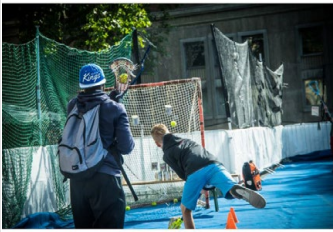
Wer möchte, kann sich auf dem Platz der Deutschen Einheit an Lacrosse-Schläger und Ball versuchen.

Treffsicherheit benötigen die Teilnehmerinnen und Teilnehmer beim Fußball-Dart, wenn sie auf die große Dartscheibe der Sportjugend Braunschweig zielen.