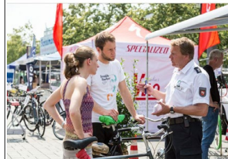
Polizei und Verkehrswacht informieren auf dem Schlossplatz zu den Themen Verkehr und Sicherheit.

Longboards, Surfskates, Forkboards – die Braunschweiger Longboard-Manufaktur informiert über die verschiedenen Board-Arten. Auf einer Teststrecke können angehende Skaterinnen und Skater die Boards auch gleich ausprobieren.