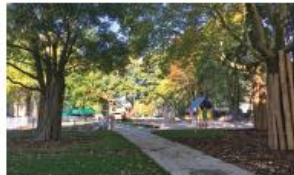
Der Spielplatz Möhlkamp kurz vor Fertigstellung der Bauarbeiten.