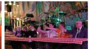
Viel Spaß und Ausdauer waren beim Biertrinken gefragt