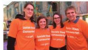
Das Team Soziale Stadt Donauviertel