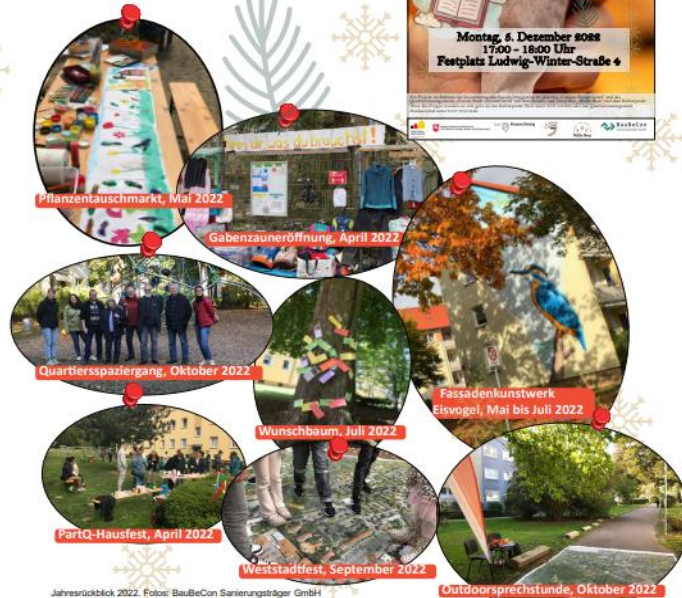
Jahresrückblick 2022.

gefördert durch: Kontakt: Mail: kb@burger@baubecon.de Tel.: 0157 73513446