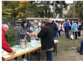
Am 14. Oktober 2022 kam man auf dem Campus zusammen, um den Gabenzaun in den Winterschlaf zu schicken