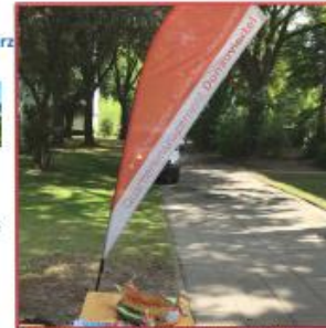
Die charakteristische Beachtflag des Quartiersmanagements

Blick auf ein Wohngebäude im Mühlberg Auch wenn die Tage wieder kürzer werden und Regen und Wind einen jetzt wieder häufiger durch den Tag begleiten: Der Herbst hat auch seine Vorzüge! Nach dem extremen Sommer dieses Jahr haben wohl alle die Hitze und das Schwitzen satt und freuen sich, die dicken Pullover aus dem Schrank zu holen. Man macht es sich zuhause gemütlich. Die Blätter an den Bäumen verfärben sich. Gerade hier im Donauviertel gibt es sicher derzeit viele schöne Farben an den Bäumen zu sehen. Nicht nur Kinder mögen das Rascheln des Laubs auf dem Boden und Kastaniensammeln. Und haben Sie schon die Kraniche gehört? Auch das Quartiersmanagement zeigt sich im Oktober wetterfest! So wird es an vier Terminen in diesem Monat eine Outdoor-Sprechstunde geben. Wenn Sie also auf dem Weg zum Einkaufen oder beim Spazierengehen an der orangefarbenen Beachtflag vorbei kommen, scheuen Sie sich nicht, stehen zu bleiben und mich anzusprechen – ich freue mich auf Gespräche aller Art. Auch für Ihre Ideen, Wünsche, Fragen oder Geschichten aus dem Quartier habe ich immer ein offenes Ohr. Gern erkläre ich Ihnen auch einmal persönlich die Arbeit eines Quartiersmanagements, den Verfügungsfonds und den Sinn fürs Donauviertel. Genauso gut ins Gespräch kommen können wir übrigens auch beim zweiten großen Quartiersspaziergang. Wieder möchten wir rund 3000