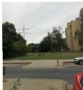
An die Ecke Am Lehmannger- „Hochspannungspark“ wird bald ein Bücherschrank ziehen. Blänke vor Ort laden zum Verweilen und Schönelem in den Büchern ein!

Gerade in der kalten Jahreszeit kann eine Geschichte selbst gelesen oder vorgelesen – die Seele aufwärmen. Am 5. Dezember 2022 steht der „Winterzauber“ an: