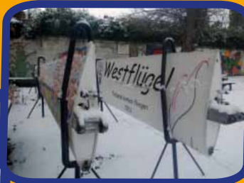
zember 2012 brachten die Schüler den ersten