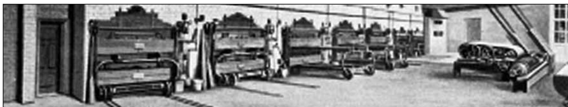
Teilansicht der Dampfbäckerei-Anlage

Im Jahr 2006 kaufte die Semmelhaack Gruppe aus Hamburg das Grundstück samt Gebäude, riss es ab und baute auf dem Grundstück einen neuen modernen Wohnkomplex.