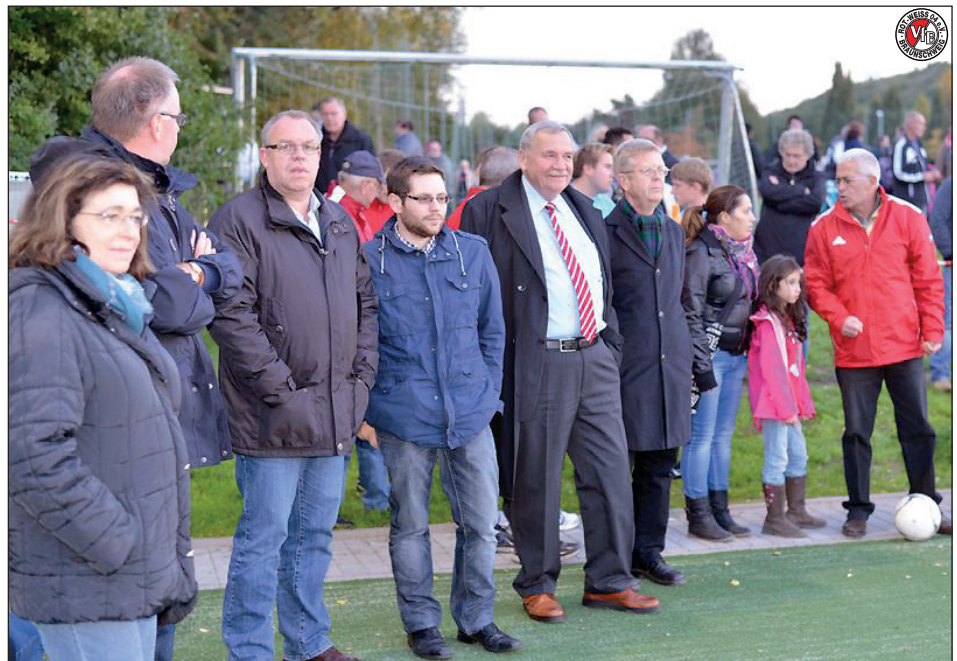
Zuschauer des Spieles auf dem Kunstrasenplatz