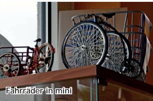
Fahrräder in mini