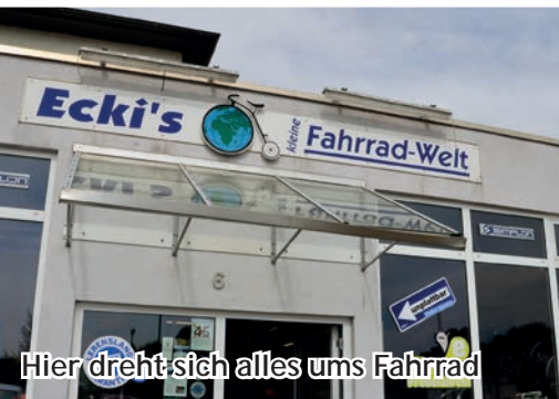
Hier dreht sich alles ums Fahrrad