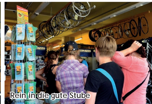
Rein in die gute Stube