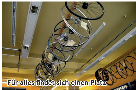
Für alles findet sich einen Platz