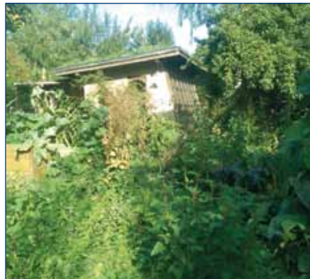
Der „JUP“ in sommerlicher Pracht 2015: Blick vom Kürbisbaum zum Lehmhaus

Wir laden Euch herzlich ein, den JugendUmweltPark an unserem „Tag des offenen Gartens“ kennenzulernen. Wir bieten Euch ein buntes Programm: Erkundet unseren Permakultur-Garten bei einer Führung - oder lernt unsere Honigbienen kennen! Weitere Programmpunkte sind in Planung. Natürlich wird es auch Getränke und Essen geben. Wir freuen uns darauf, mit Euch einen schönen Tag zu verbringen!