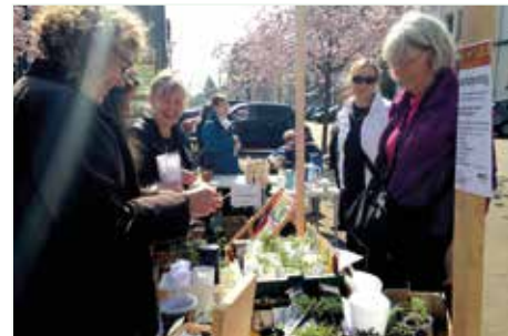
Team vom Stadtgarten Bebelhof