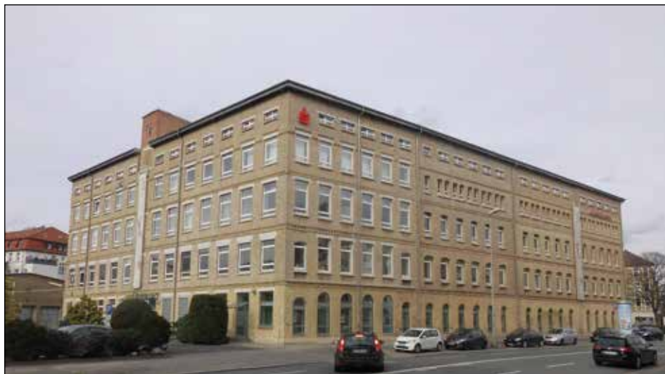
Eisenvater März 2017

zu wachsen, sodass sie mit einer Reihe Niederlassungen in Lüneburg, Gifhorn und Munster zu einem der bedeutendsten Handelshäuser ihrer Branche im niedersächsischen Raum zählte und als Zulieferer von Handwerk und Industrie dem Wirtschaftsraum zwischen Harz und Heide geworden war. Im Jahr 2002 wurde das braunschweiger Traditionsunternehmen vor den Toren der Stadt verlagert. Eine