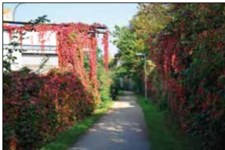
Ringgleis

und kommende Veranstaltungen (Führungen/Wanderungen, Infostände), auf interessante Gärten am Ringgleis