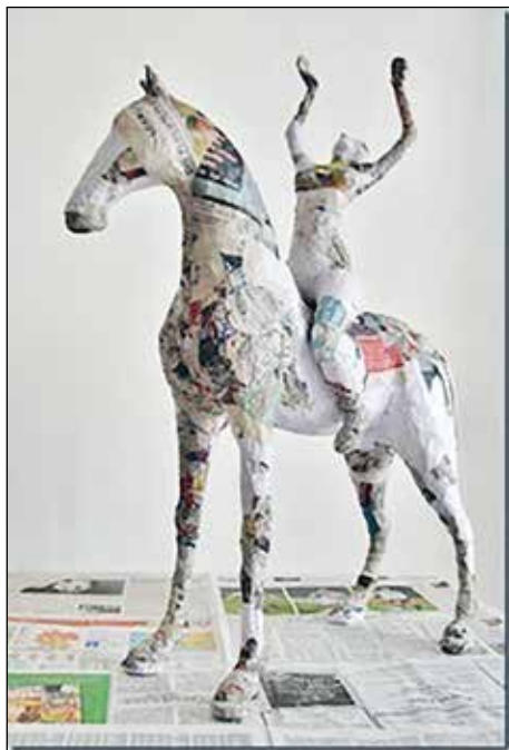
Traumfängerin von Ewald Wegner

weiterhin Veranstaltungen geben. Wie sich alles Geplante in 3 Räumen realisieren lässt, das muss die Gruppe sich noch erarbeiten.