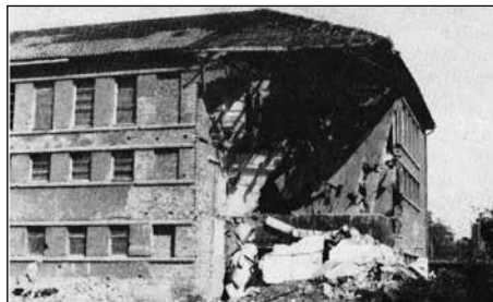
Stadtbad Bombenschaden 1944