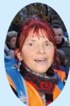
Ihre Marion Tempel

Bitte achten Sie gerade jetzt in der dunklen Zeit gut auf Ihr Fahrrad, damit Ihnen nicht das Gleiche passiert.