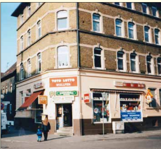
Farbfoto: 1995 ehem. Konsumgeschäft