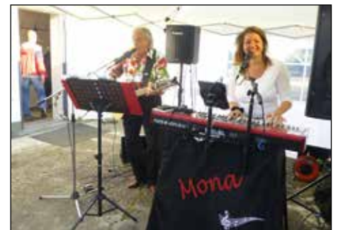
Das Mona Duo