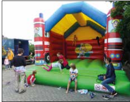
Spaß in der Hüpfburg

Um 14.30 eröffnet das Kuchenbuffet. Gleichzeitig fängt der "Kinderspaß" an – mit dem Funmobil und Hüpfburg, Spielen, Schminken und Überraschungen.