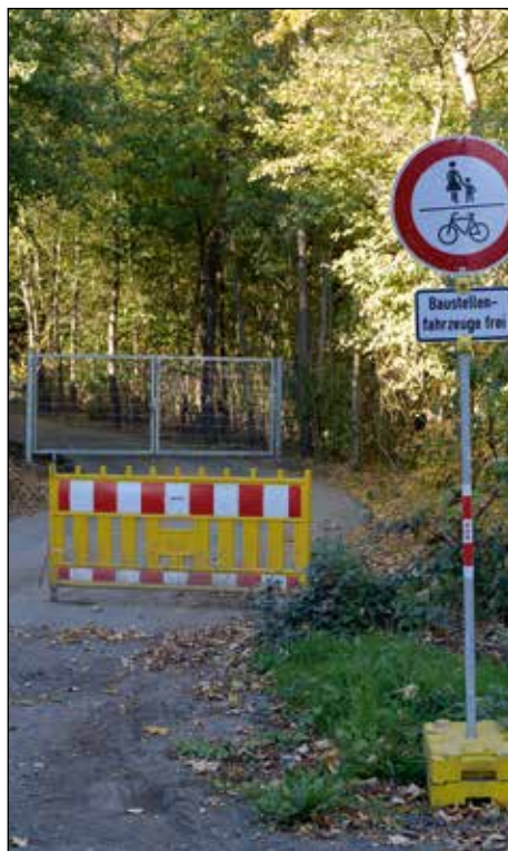
Beginn der Baustraße vom Madamenweg her

über den Madamenweg Richtung Ring zu transportieren, aber dabei läuft leider nicht alles rund. Beschwerden über Staub und Lärm häufen sich und auch die grundsätzliche Sperrung des ehemaligen Rad- und Fußweges an der Tangente, der jetzt die Baustraße ist, verärgert die Anwohnerinnen und Anwohner. Besonders natürlich die Besitzer der Kleingärten, die nur unter erschwerten Bedingungen ihre Gärten erreichen können. Es ist auch nicht einzusehen, weshalb die Baustraße nicht außerhalb der Abtransportzeiten für die Öffentlichkeit zugänglich sein soll, beispielsweise an Wochenenden und Feiertagen, aber auch abends nach 17 Uhr. Ein entsprechender Antrag der LINKEN wurde im Bezirksrat mehrheitlich beschlossen. Aber ein Handeln der Verwaltung ist bis dato leider noch nicht erfolgt. Hier gilt es also nachzuhaken, damit sich etwas tut. Leider hat der Bezirksrat hier keine Entscheidungsfunktion, kann aber dennoch auf die Wünsche der Anlie-