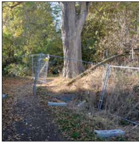
Sogar der kleine Verbindungsweg zwischen Kreuzstraße und Feldstraße ist versperrt.

Im Westlichen Ringgebiet tut sich einiges. Eine Reihe neuer Baugebiete entsteht im Bereich der Hildesheimer Straße (Noltmeyer Höfe) sowie der Ernst-Amme-Straße. Auch in der Feldstraße, also in der Kälberwiese, werden auf dem Gelände der ehemaligen Bezirkssportanlage Maßnahmen für eine Bebauung getroffen: Hier muss aber zunächst belasteter Boden abtransportiert werden. Diese Bodensanierungsarbeiten stellen natürlich eine Belastung der Anlieger dar. Mit der neuen Baustraße an der Tangente ist zwar der Versuch unternommen worden, diese Belastungen zu minimieren, die Erde also nicht