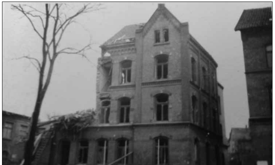
Frankfurter Straße Nr. 257