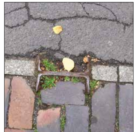
Der Rest der Barrikade vor der Frankfurter Straße Nr. 257