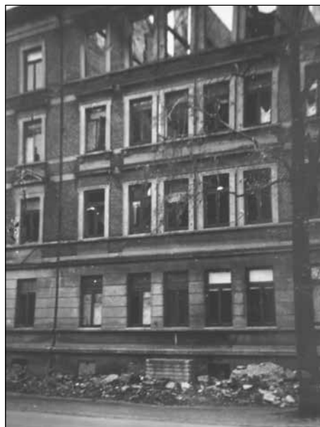
Linke Seite - Barrikade Haus Nr. 34